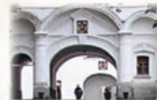
Современная мостовая из шокшинского кварцитопесчаника, ведущая к Святым Вратам

10 БОЛЬШАЯ ГОСТИНИЦА, современное название – Зимняя. Была возведена в середине XIX в. по указанию благочинного Валаамского монастыря архимандрита (будущего святителя) Игнатия Брянчанинова «устроить гостиницу вне монастыря», поскольку имевшаяся гостиница служила «причиной пустых слухов и соблазнов», т. е. «останавливаются в ней посетители обоего пола, что для благоустроенного монастыря неприлично». Указания благочинного были выполнены: гостиницу вынесли на отдаление от монастыря, к юго-востоку (А. М. Горностаев).